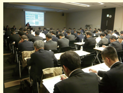
機関投資家向け会社説明会

当社では、機関投資家やアナリスト向けの会社説明会を毎年2回東京で開催しております。また、証券会社と共催で地元の個人投資家向けの会社説明会も開催いたしました。