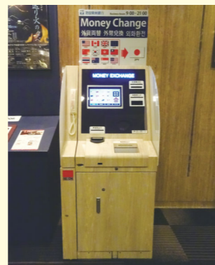
からすま京都ホテル