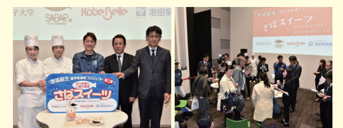
株式会社鯖や×株式会社ベル×梅花女子大学