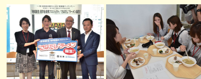
株式会社鯖や×株式会社北海×梅花女子大学食文化学部