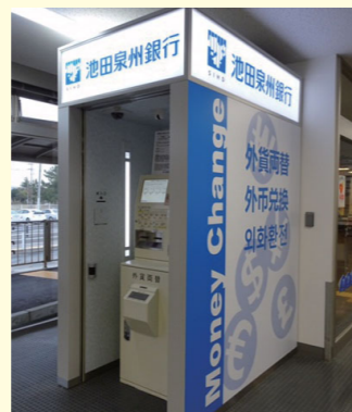
神戸ベイ・シャトル

※からすま京都ホテル自動外貨両替コーナーについては、他社に運営を委託しております。