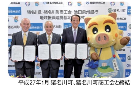
平成27年1月 猪名川町、猪名川町商工会と締結

また、協定締結を機に「産業振興融資ファンド」「創エネ・省エネ融資ファンド」などを創設し、地域の事業者の皆さまへの資金供給や、「地域ブランド」の育成・全国発信のお手伝いなど、地域の活性化に努めてまいります。