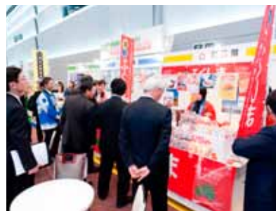
写真は、昨年の「ビジネス・エンカレッジ・フェア2012」

平成25年12月3日・4日の両日、「大阪国際会議場」において、『 ビジネス・エンカレッジ・フェア2013～関西と東北 未来へ進むチカラが集う～ 』を但馬銀行、鳥取銀行との共催で開催しました。平成12年より続く当フェアの趣旨「地元関西の仕事の創造、競争力強化のお役に立ちたい」との想いで、関西の産学官金ネットワーク参加による多面的なビジネスチャンスの創出に加え、本年も引き続き、東北の地銀（岩手銀行、東北銀行、七十七銀行、東邦銀行）と連携して東日本大震災からの復興を応援しました。当行は、これからも「地域第一主義」「お客さま第一主義」を念頭に、地域の活性化に貢献してまいります。