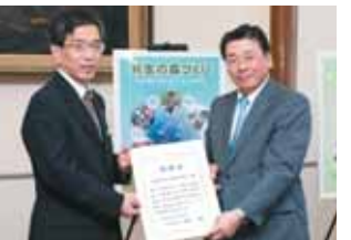
大阪府みどりの基金及び共生の森づくり基金から (平成24年10月24日)