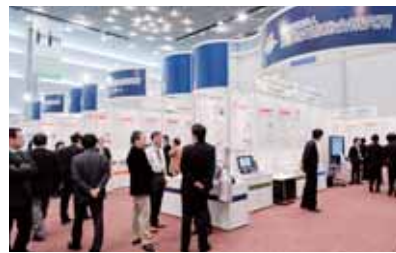
写真は、昨年の「ビジネス・エンカレッジ・フェア2011」

平成12年より続く当行フェアの趣旨「地元関西の仕事の創造、競争力強化のお役に立ちたい」との想いで、関西の産学官金ネットワーク参加による多面的なビジネスチャンスの創出に加え、昨年引き続き東北の4銀行とも連携して東日本大震災からの復興を応援しました。当行は、これからも「地域第一主義」「お客さま第一主義」を念頭に、地域の活性化に貢献してまいります。