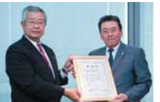
大阪みどりのトラスト協会から (平成24年10月3日)

当行は、平成24年9月25日、「みどりひろがる」街づくりを応援するために、大阪府及び兵庫県の緑化推進4団体へ総額160万円の寄付を行いました。これは、当行が平成24年3月から7月まで取扱いしました「みどりひろがる定期預金」に基づき拠出したもので、各団体から感謝状を頂戴しました。これも、「みどりひろがる定期預金」が、多くのお客さまのご賛同をいただいた結果と、厚くお礼申し上げます。