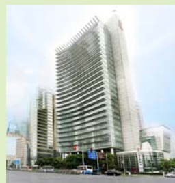
中国工商銀行（上海支店）

平成23年9月2日、中国大手2銀行の中国工商銀行（本店北京・中国最大の店舗網を持つ）と、交通銀行（本店上海・1908年創設の最も古い歴史を持つ）と提携しました。このほかにも、人民元決済ニーズに、より機動的にお応えするために、中国銀行（本店北京・現地金融機関の中でも貿易・外為業務に長い歴史を持つ）の東京支店に人民元決済口座を開設しています。