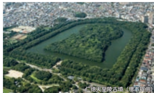
仁徳天皇陵古墳